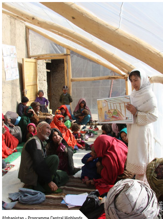
Afghanistan - Programme Central Highlands

Enfin, la gestion de la sécurité doit faire l'objet d'un travail spécifique dont les éléments arrêtés doivent être validés par les directions générales des structures du consortium. Mettre en place un comité de sécurité entre partenaires est particulièrement pertinent dans les pays et régions à haut niveau d'insécurité. Ce comité a non seulement un rôle d'échanges d'informations, mais aussi d'adoption de certaines règles conjointes de sécurité et/ou de définition des protocoles ou règles ad hoc de sécurité entre membres, tout en tenant compte de la « souveraineté » des acteurs du consortium, internationaux et nationaux. Tout aussi important est donc de préciser le rôle de la coordination / chef de file en la matière, ses prérogatives, pouvoirs et limites.