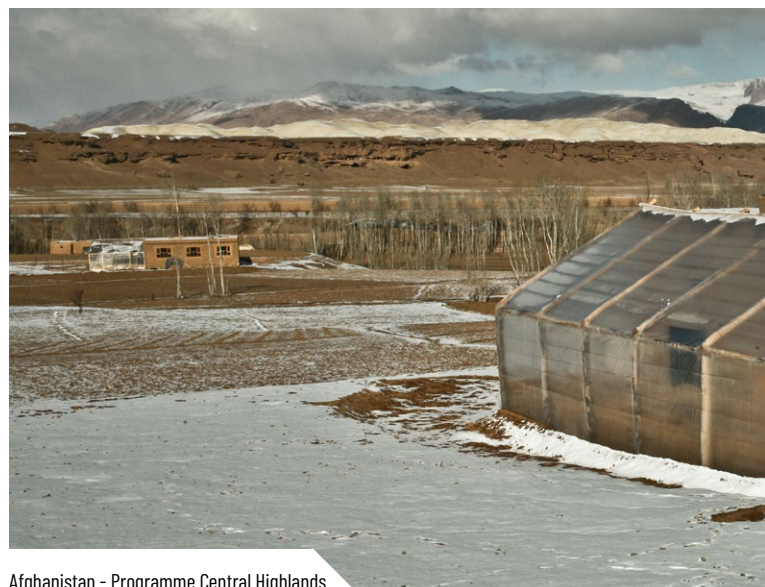
Afghanistan - Programme Central Highlands

En revanche, ces conventions manquent souvent de précision pour les retards de reporting, de trésorerie ou de défaut d'image. Et encore une fois, si défaillance il y a, et si les médiations souvent envisagées ne parviennent pas à trouver un terrain d'entente, les recours juridiques sont souvent peu fréquents, voire inexistantes. Le cas du consortium TIMAMA MdM-ID en Haïti signale qu'en cas de pertes financières justifiées mais non assumées - coûts inéligibles -, l'ONG ira directement au procès contre le partenaire incriminé.