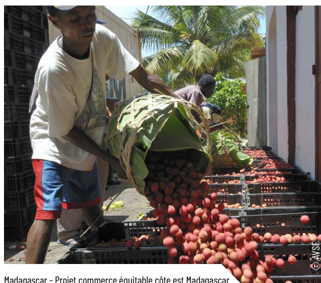
Madagascar - Projet commerce équitable côte est Madagascar

Cette opportunité vaut non seulement dans le cas de consortium ONG, mais d'autant plus dans le cas de consortium collectivités-ONG et entreprises-ONG, lorsque la cause promue ou défendue est également portée par d'autres acteurs dotés d'une légitimité indéniable ou bénéficiant d'une écoute attentive.