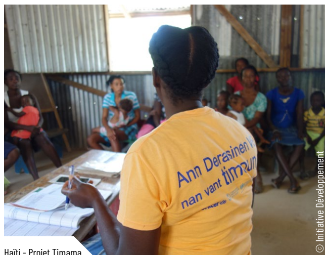
Haïti - Projet Timama

Si les réponses à ces questions confirment l'intérêt du choix du consortium, il s'agit alors de prévenir les risques potentiels dès la création du consortium, la négociation et l'identification de l'action.