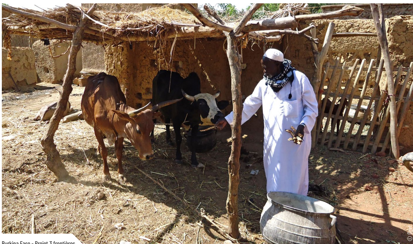
Burkina Faso - Projet 3 frontières

Si les organisations membres du consortium en France sont « amies » de longues dates et collaborent régulièrement en bilatéral, toutes voient dans ce consortium une opportunité de faire vivre sur un terrain complexe, au sein des équipes opérationnelles, les plus-values des synergies permises par l'appartenance au Groupe initiatives . Le CIEDEL a ainsi un rôle spécifique dans le consortium, d'animation des dynamiques d'apprentissages croisés, de partage de pratiques et de gestion des savoirs. Il s'agit également de capitaliser sur les innovations collectives particulièrement nécessaires concernant les modalités d'intervention et de gestion de la sécurité dans un contexte inédit en termes de dégradation sécuritaire et d'affaiblissement à l'extrême des pouvoirs locaux.