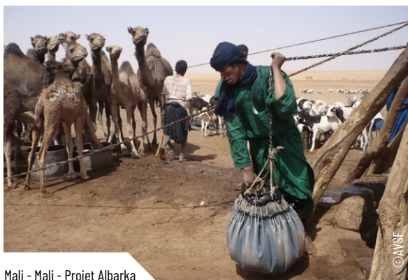
Mali - Mali - Projet Albarka

L'action en consortium a permis un renforcement des capacités respectives des cadres des 4 partenaires au niveau du pays et du projet, en particulier sur les questions de sécurité : analyse et procédures. La constitution du consortium a permis d'affiner l'analyse du contexte sécuritaire, issue de l'expérience de ses membres, de leurs connaissances complémentaires des différents terrains et acteurs. Cela a permis de mettre en place des protocoles de sécurité mieux adaptés. Cette expérience a également contribué à la construction d'un accord cadre pour la gestion conjointe de « crise » entre plusieurs membres du réseau VSF international, impliqués au Sahel et dans la Corne de l'Afrique.