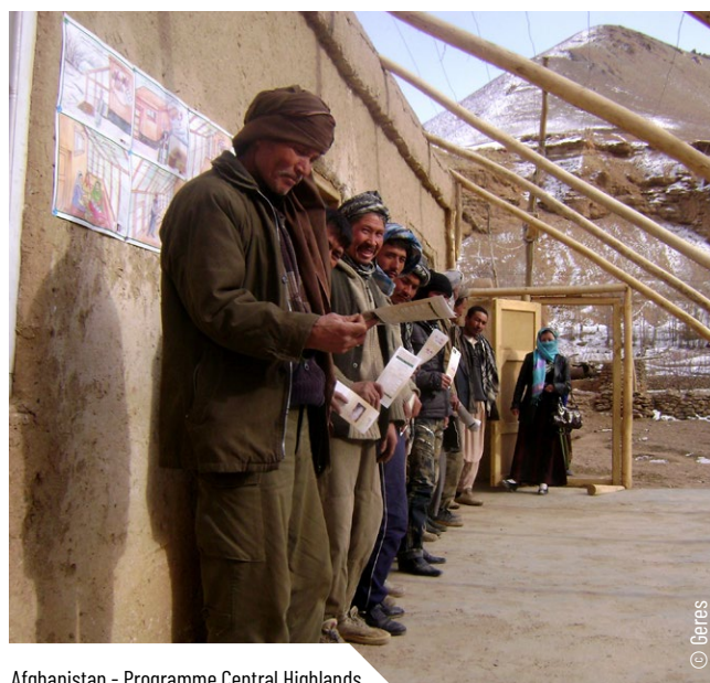
Afghanistan - Programme Central Highlands

✎ Faire confiance au consortium et être à l'écoute : la pression parfois exercée par les partenaires financiers (exigences sur les décaissements, les résultats, etc.), y compris hors des instances formelles de gouvernance du consortium, est parfois contre-productive : elle pousse chacun des membres à vouloir avancer trop rapidement, parfois de manière non coordonnée, et sauter des étapes pourtant cruciales.