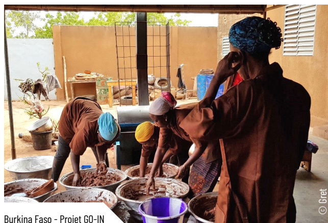
Burkina Faso - Projet GO-IN

Parce que le consortium exacerbe ces risques, quelles sont donc les modalités et les conditions pour mieux les prévenir et les gérer, et à quels coûts ?