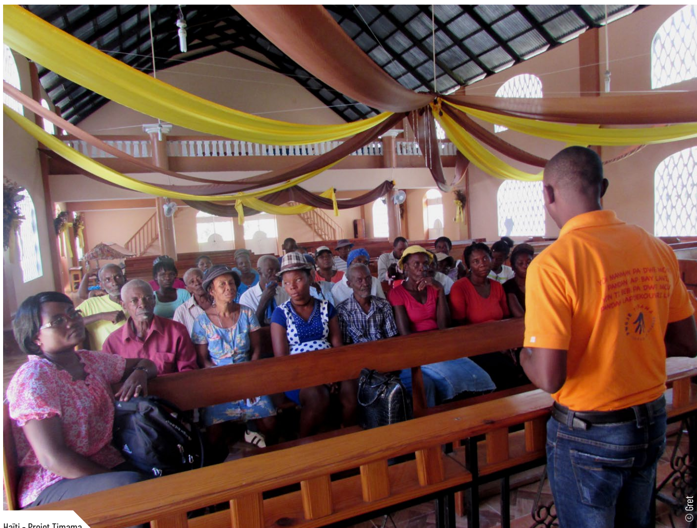
Haïti - Projet Timama

des compléments de coûts de transactions entre partenaires, ainsi que des coûts de fonctionnement de l'ONG , y compris en France et en Europe (déplacements réunions, comité de pilotage, participations à des événements divers, communication, capitalisation, etc.). Si l'entreprise partie prenante du consortium contribue normalement à ces coûts, force est de constater qu'elle est normalement peu encline à trop dépenser de ressources financières sur des coûts de transaction ou de fonctionnement, pourtant requis, au détriment d'investissements - matériels ou immatériels - productifs.