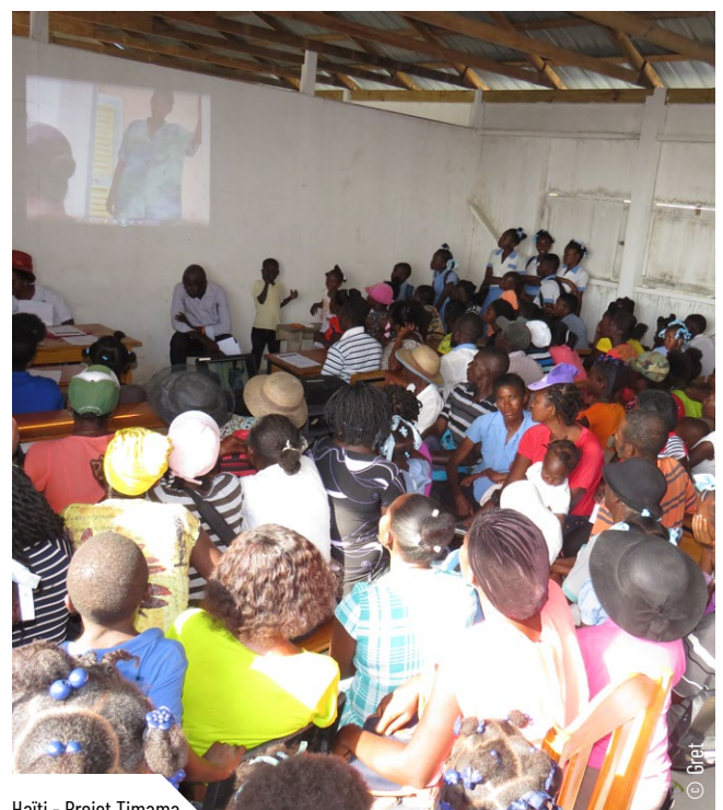
Haiti - Projet Timama