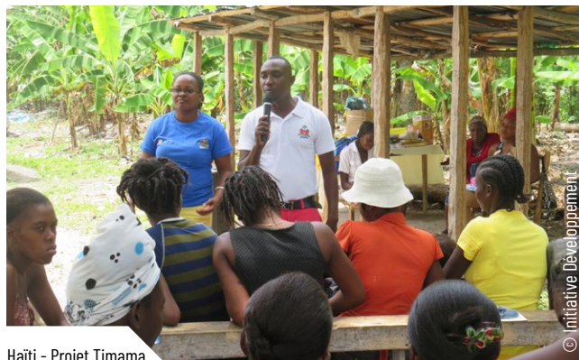
Haiti - Projet Timama

d'une vision globale partagée, jusqu'à renforcer tout au long de l'action, une confiance réciproque et un langage et des principes d'intervention communs.